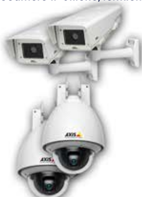
Telecamere IP ONVIF